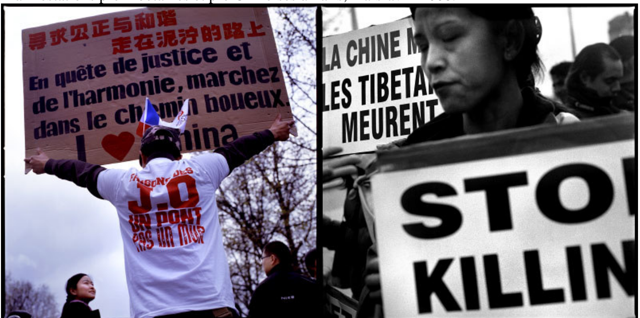
Manifestations pro Tibetaïnes et pro Chinoises à Paris, mars-avril 2008.