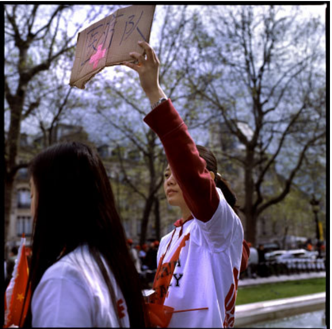
Manifestations pro Tibetaïnes et pro Chinoises à Paris, mars-avril 2008.