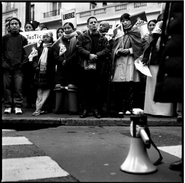
Manifestations pro Tibetaïnes et pro Chinoises à Paris, mars-avril 2008.