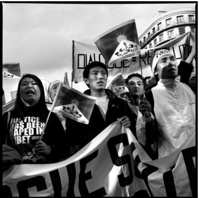
Manifestations pro Tibetaïnes et pro Chinoises à Paris, mars-avril 2008.