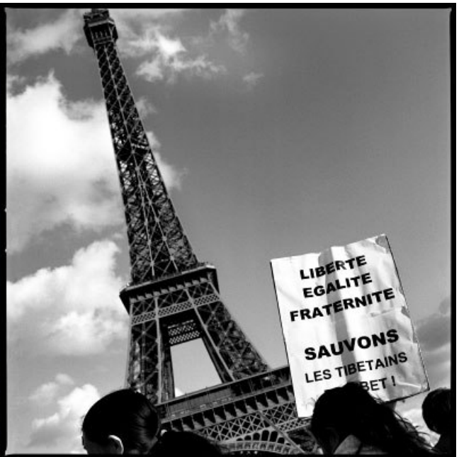
Manifestations pro Tibetaïnes et pro Chinoises à Paris, mars-avril 2008.