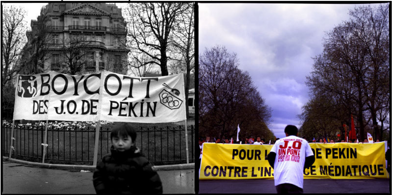
Manifestations pro Tibetaïnes et pro Chinoises à Paris, mars-avril 2008.