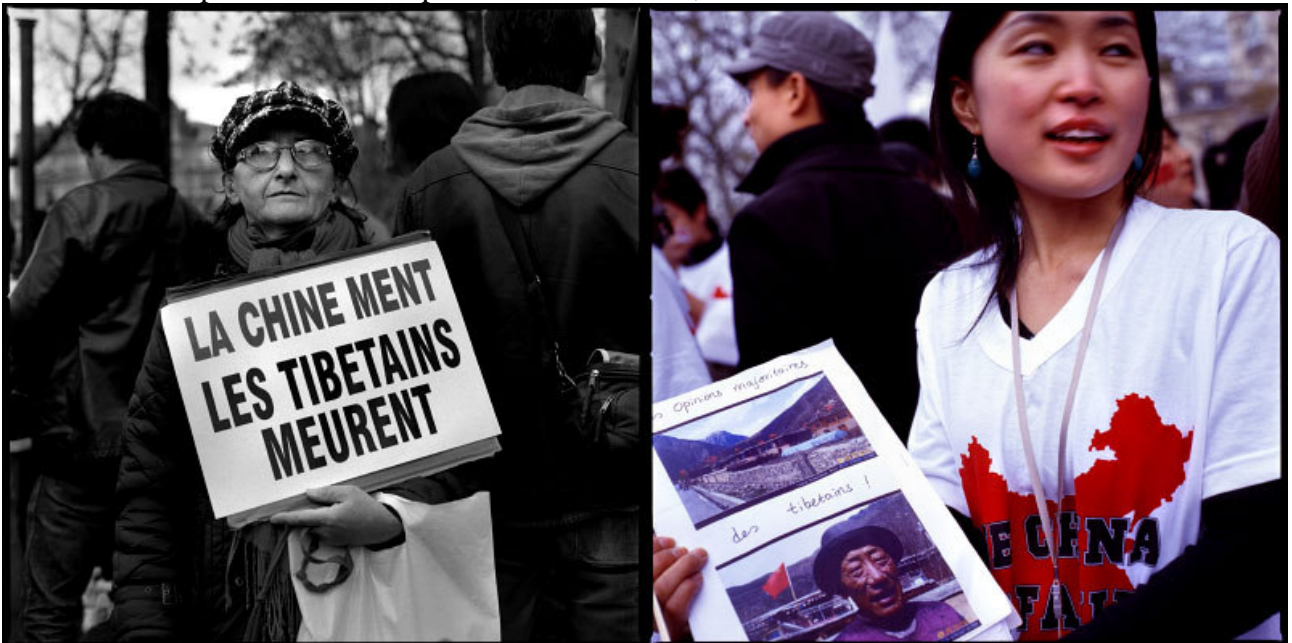
Manifestations pro Tibetaïnes et pro Chinoises à Paris, mars-avril 2008.