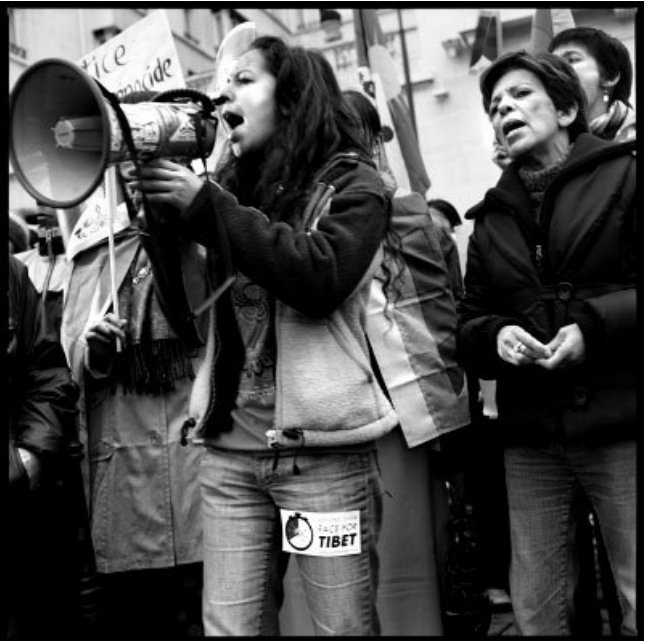
Manifestations pro Tibetaïnes et pro Chinoises à Paris, mars-avril 2008.