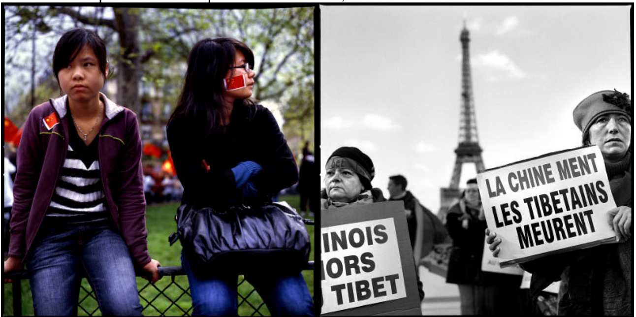
Manifestations pro Tibetaïnes et pro Chinoises à Paris, mars-avril 2008.