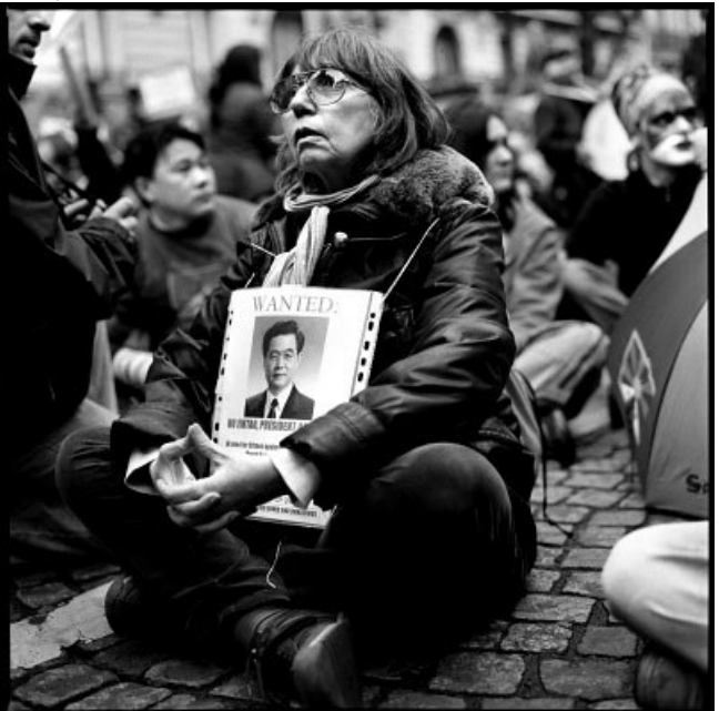
Manifestations pro Tibetaïnes et pro Chinoises à Paris, mars-avril 2008.