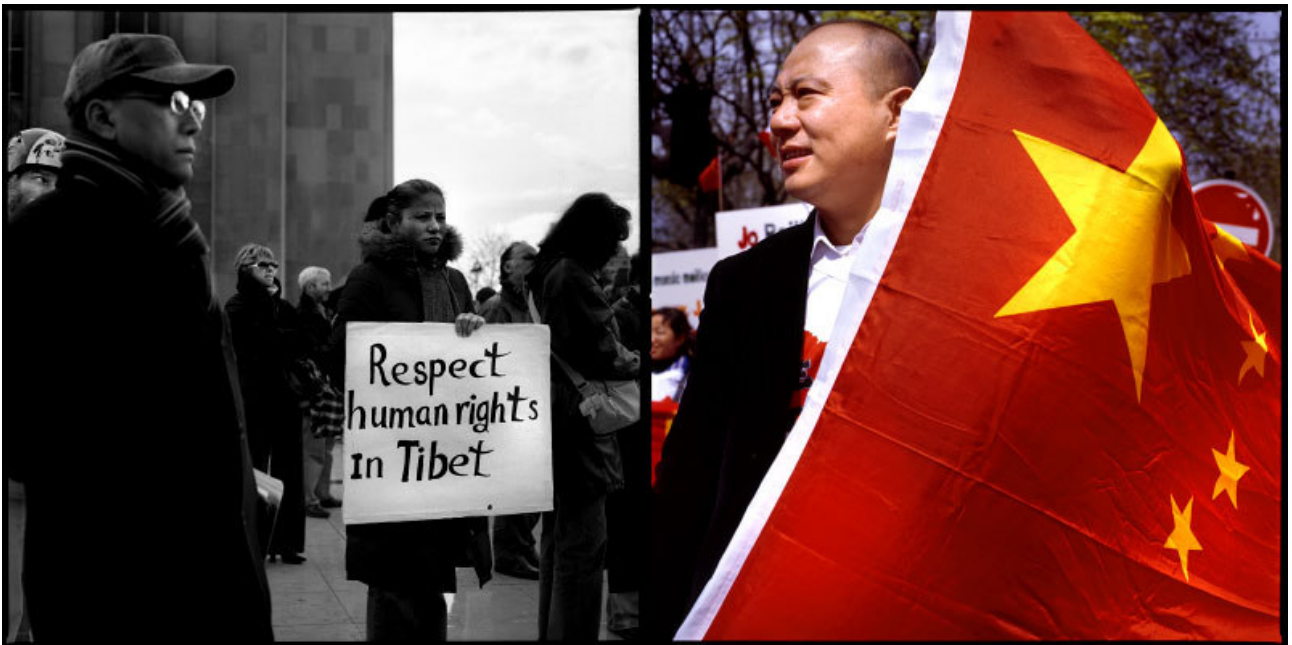
Manifestations pro Tibetaïnes et pro Chinoises à Paris, mars-avril 2008.