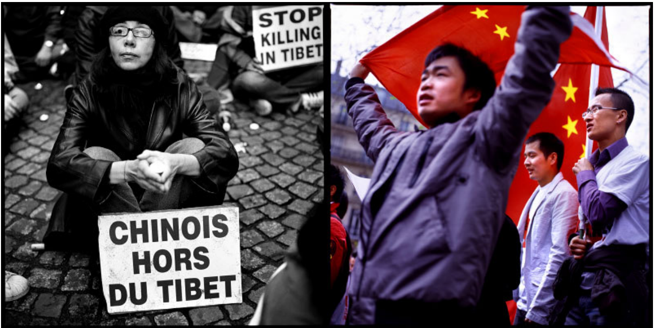
Manifestations pro Tibetaïnes et pro Chinoises à Paris, mars-avril 2008.